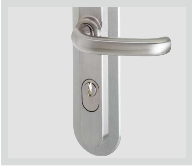
Euro-Profilzylinder mit Kernziehschutz. Abb. mit Dekorplatte