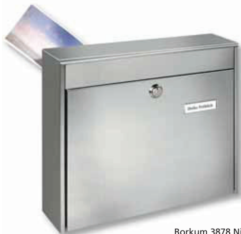
Borkum 3878 Ni