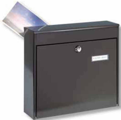
Potsdam 878 BR

Info: Alle Zaunbriefkästen eignen sich auch für die Montage an der Tür-Innenseite und sind so als Durchwurfkasten nutzbar. Die Einwurfsklappe an der Rückseite lässt sich problemlos ausbauen.