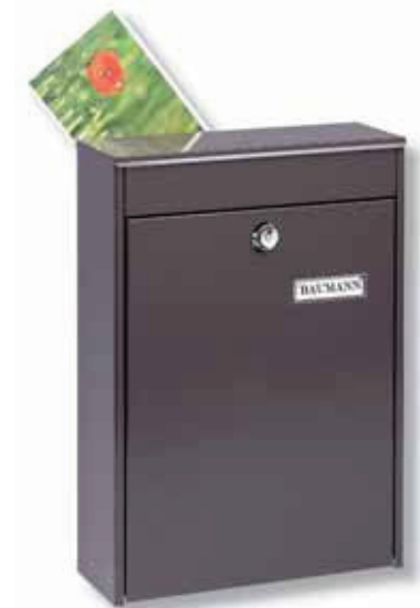
Leipzig 778 BR